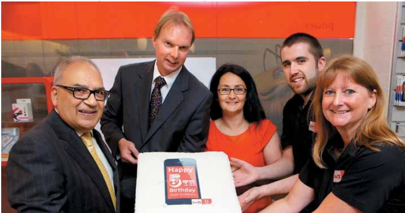
Airtel Îles Anglo-Normandes célèbre son cinquième anniversaire