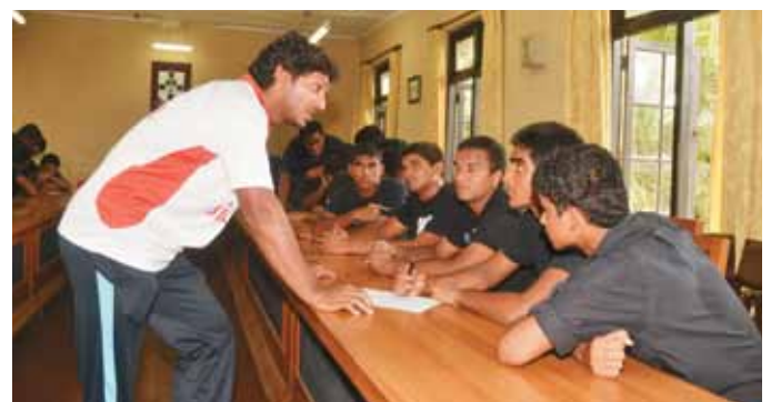
Kumar Sangakkara, ancien capitaine de l'équipe nationale de cricket du Sri Lanka et ambassadeur d'Airtel motive les joueurs de rugby du collège St. Peters.

Le rugby a toujours été un sport extrêmement populaire et très suivi au Sri Lanka. En effet, il se place en deuxième position après le cricket, avec le Sri Lanka occupant la 5ème place dans le classement du rugby asiatique. S'engageant dans cette voie, Airtel Lanka a noué récemment deux partenariats stratégiques avec