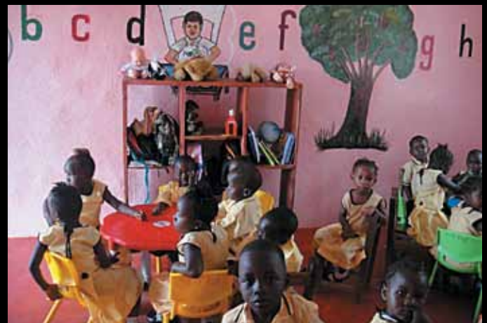
Les nouvelles salles de classe

L'entreprise a rénové une vieille structure délabrée, fournit un matériel pédagogique, et fait don de matériels scolaires tels que des tableaux noirs, des tables et des chaises. Elle a également distribué aux élèves des manuels scolaires, des cahiers, et des stylos ainsi que des uniformes.