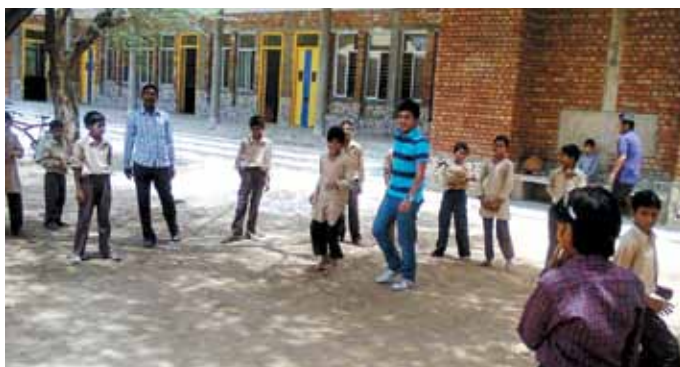
Dans la tradition des écoles Satya Bharti, l'éducation va au-delà des salles de classe et des manuels scolaires

Depuis le lancement du programme en 2006, la Fondation Satya Bharti prend en charge 38 000 élèves répartis entre ses 253 écoles opérationnelles à travers le Pendjab, le Rajasthan, l'Haryana, l'Uttar Pradesh, le Tamil Nadu et le Bengal Occidental. Cette initiative a également reçu des distinctions nationales et internationales pour les méthodes d'enseignement novatrices et holistiques dispensées dans les écoles Satya Bharti. ■