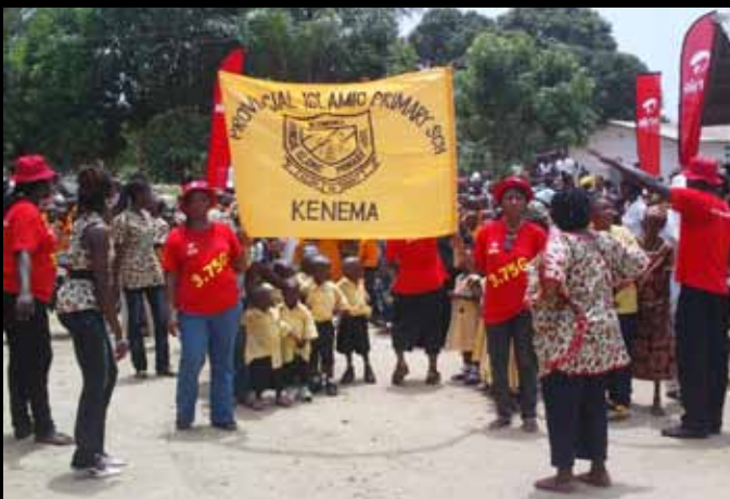
Inauguration de l'école au rythme des fanfares

Airtel est passé à une nouvelle phase de son initiative d'adoption scolaire en Afrique ; Rénovation et ouverture de la « Provincial Primary School » — Sa deuxième école en Sierra Leone